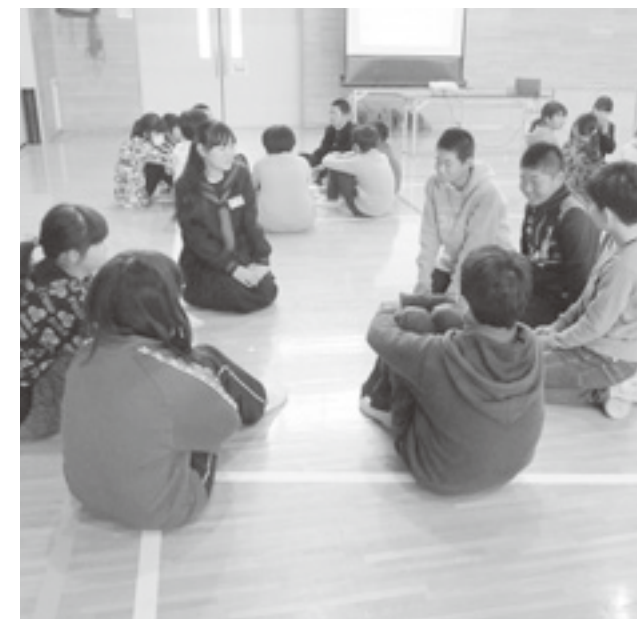
↑先輩中学生から詳しい話を聞く。不安が解消されると朗らかな笑顔に。

こと、テストや勉強のこと、部活動のことなど中学生の「生の声」を聞けるので小学生はとても楽しみにしています。小野校区ではこれからも小・中学校の連携を深め、楽しい学校づくりに努めます。