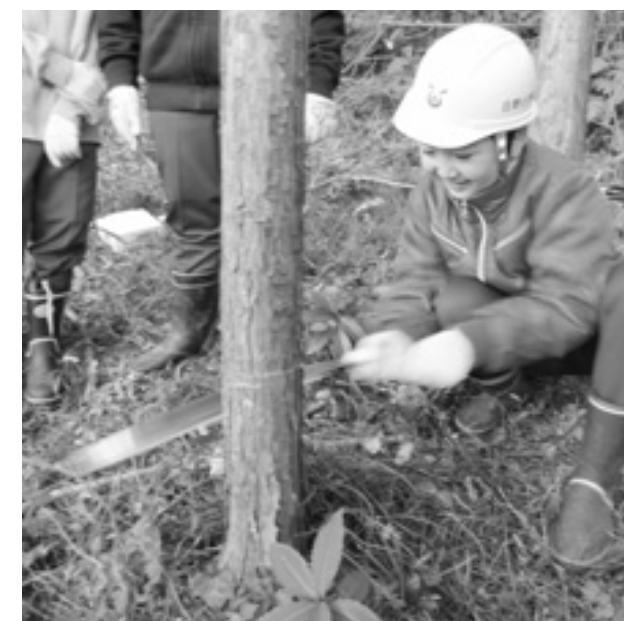
↑自分の何倍も高い5メートル級の木も伐採。木を切った後は森の中に光が入ってきてきれいだった。

す。「自然の中で育つことは想像以上に子どもたちに影響を与えています」。それは雄大な自然の力があってこそ。日野小学校ではこれからも自然に身近な日野ならではの学習を続けていきます。