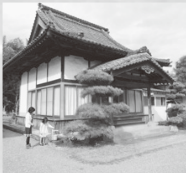
市指定重要文化財の涅槃釈迦像が安置される清見寺