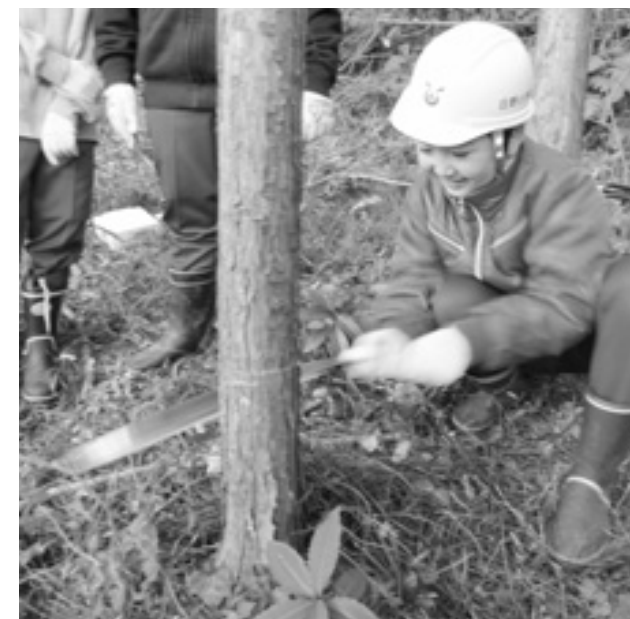
↑自分の何倍も高い5メートル級の木も伐採。木を切った後は森の中に光が入ってきてきれいだった。

す。「自然の中で育つことは想像以上に子どもたちに影響を与えています」。それは雄大な自然の力があってこそ。日野小学校ではこれからも自然に身近な日野ならではの学習を続けていきます。