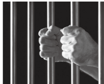
刑を終えた人の人権

刑を終えて出所した人やその家族に対する差別。これらの人々の社会復帰のためには、周りの人々の理解と協力が必要不可欠です。