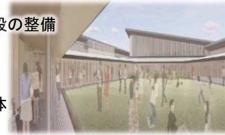
複合施設イメージ図