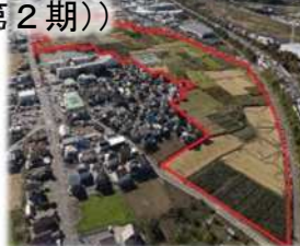
西部工業団地予定地