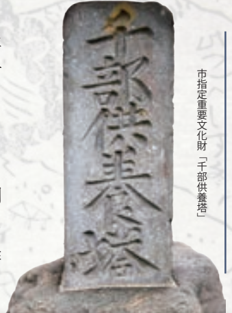
市指定重要文化財「千部供養塔」

本企画展では当時の藤岡宿で浅間山の噴火の状況、周囲の状況についてどう伝えていたかを史料を通じて紹介します。また、「千部供養塔」など当時の一大事件を後世に伝えるために行ったことや災害復興についても展示します。