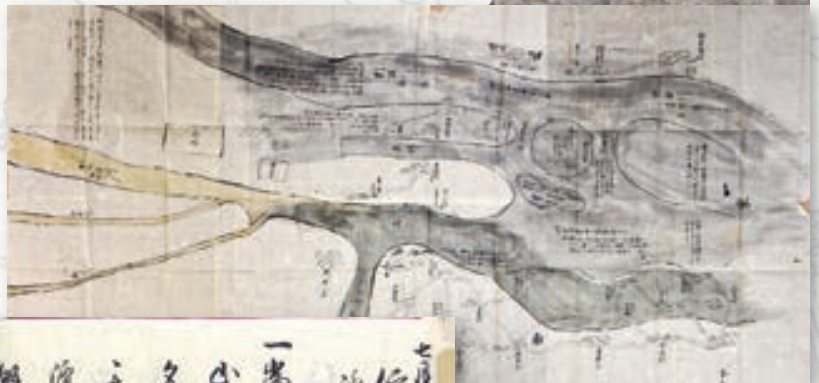
川筋村々流候絵図（三井文庫所蔵）