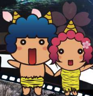
おにたん おにりん