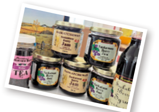
バノックとサスカトゥーンベリージャム