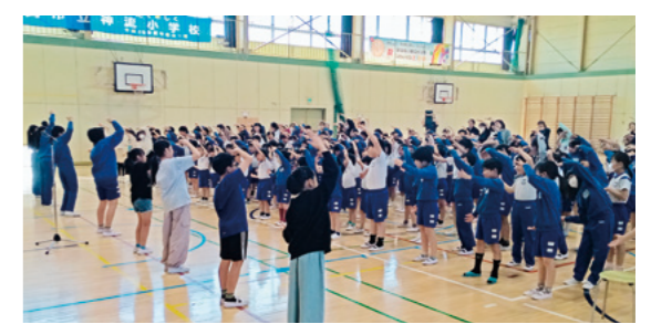
「E・Y・T」と大きな声で掛け合う児童

例を挙げると、児童会の本部役員が中心となって行っていたペットボトルキャップの回収には環境委