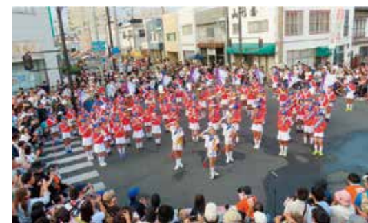
藤岡まつりに参加した6年生のマーチングパレード

藤岡まつりのマーチングパレードでは、観客の皆さんの温かな声援や拍手に後押しされ、6年生が力強く美しい演奏を披露することができました。そん