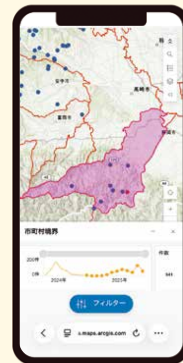
本市のツキノワグマ目撃数および錯誤捕獲数 ※

市民の皆さんも、日ごろからクマを寄せ付けないことや、出会わないようにすることを心がけ、目撃した場合は森林課または藤岡警察署まで連絡をしてください。