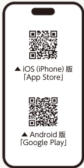
▲iOS (iPhone) 版 [App Store]