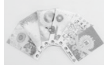
市内小学生が作画した花種袋

花と緑と笑顔あふれるまちづくり事業は、花と緑のぐんまづくりの理念を継承した市独自の事業として、令和4年度から市民協働によるまちづくりを目的に活動しています。大輪の花を咲かせ、地域の絆を広げていきましょう。