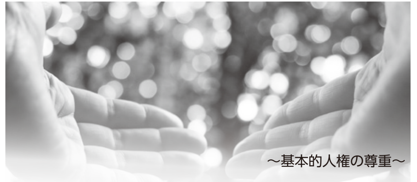
～基本的人権の尊重～

人権とは「人が生まれながらに持っている誰にも侵されない権利」であり、「全ての人が、個人としての生存と自由を確保し、社会において幸福な生活を営むために欠かすことのできない権利」です。