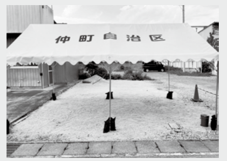
仲町自治会に整備した集会用テント