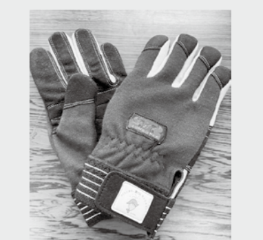
藤岡市消防団に整備した耐切創手袋

(一財)自治総合センターは、宝くじの社会貢献広報事業の一環として、宝くじの受託事業収入や収益金を財源に自治会や消防団などへの助成事業を行っています。 今年度は、市内17公会堂にコミュニティ活動関連備品、藤岡市消防団へ耐切創手袋(防寒・防水タイプ)を整備しました。 問い合わせ ▶コミュニティ活動関連備品=地域づくり課(☎40 2211)▶消防団備品整備=地域安全課(☎22 7444)