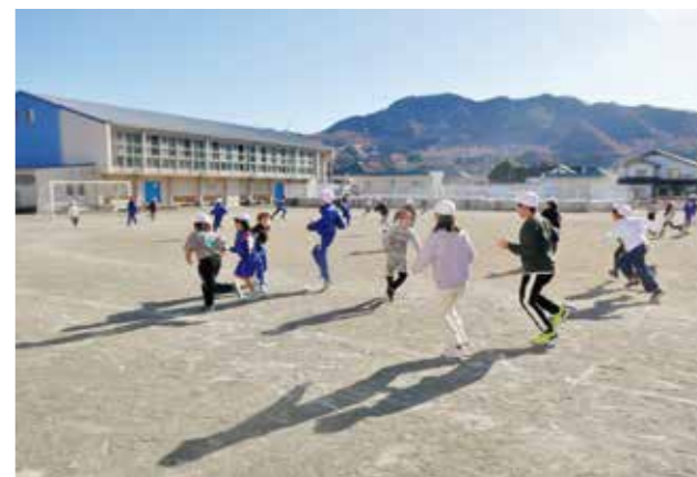
みんなで仲良く遊ぶ全校鬼ごっこ

本校では、「いじめは絶対に許さない」という信念をもち、認め合えるような集団をつくる」ことを目指してさまざまな活動に取り組んでいます。その1つに縦割り班での活動があります。毎年10月に実施する「全校桜山遠足」では、リーダーである6年生が