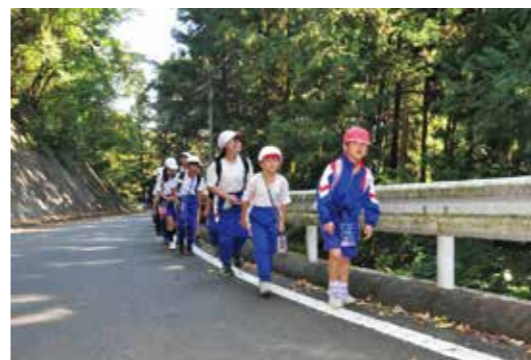
励まし合いながら登る全校桜山遠足