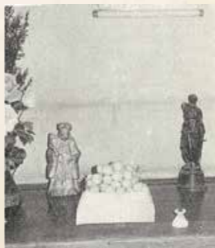
オシラ様に供えられた繭玉(中倉)

こうしたことから、かつては蚕神への信仰や豊蚕祈願も盛んでした。また、地域の神社や寺院では農家の祈願に応じ、養蚕加護の御札などを出していたといわれています。