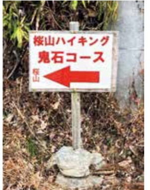
ハイキングコース入口などに設置した道しるべ

実施し、誰もが安全で安心して利用できる公園を目指し管理してまいりますので、ご理解ご協力をお願いいたします。 ■桜山公園のハイキングコースについて 桜山公園を訪問し、市が推奨する桜山ハイキングコース(鬼石・桜山ルート)を歩きましたが、マップに記載しているルートの入口やコースの随所に道しるべが設置されていませんでした。ハイキングコースを精査し、道しるべを設置するなどの改善を希望します。 A 鬼石・桜山ルートのハイキングコースを踏査したところ、ご指摘をいただいたとおり分かりやすい道しるべが設置されていませんでした。このようなことから、ハイキングする人の安全と安心を確保するため、12月中に道しるべを設置したいと考えております。 にぎわい観光課