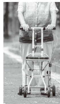
介護保険運営協議会委員