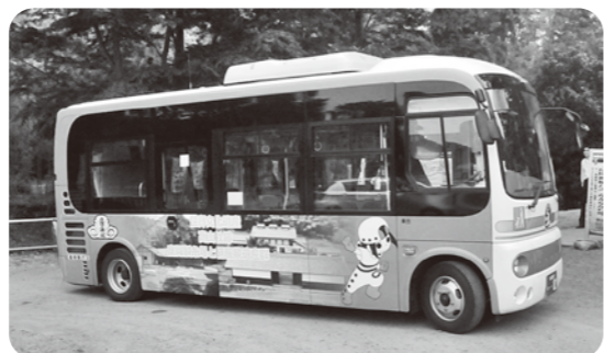
ラッピング広告のイメージ

申込期限 随時募集しています 問い合わせ 多野藤岡広域市町村圏振興整備組合(☎241621)