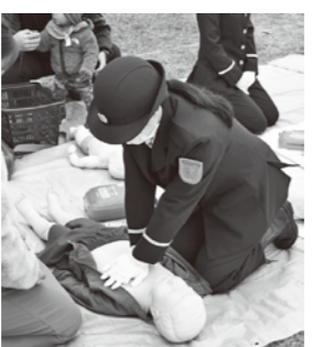
各種イベントで救命講習を実施

藤岡市消防団は14分団で組織されています。そのうち、第10分団「フレイムス」は、平成6年に県内市町村で初めて女性のみで発足し、現在は団員15人で活動しています。