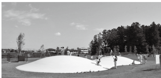
全長24mのふわふわドーム

「10年、20年先の都市環境を創造するまちづくり」をテーマとした藤岡市の施策を紹介します。