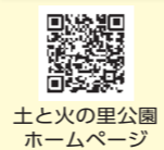
土と火の里公園 ホームページ