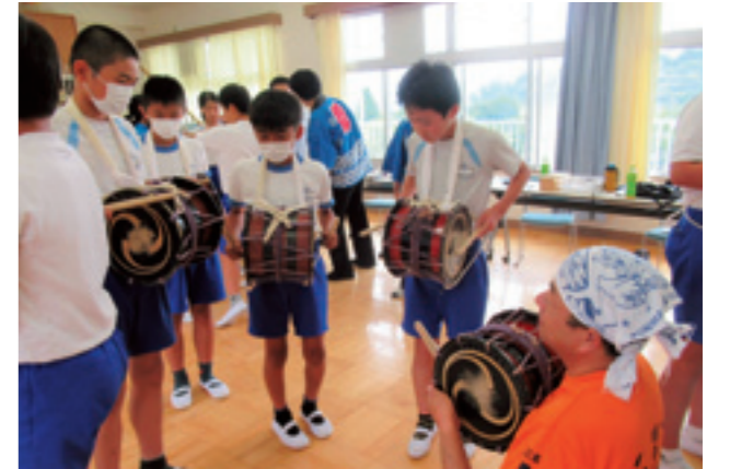
神田獅子舞保存会「郷土の伝統文化を学ぶ」

読み聞かせ(さくらの会)や自然体験活動(稲穂の会)、蚕の飼育・まゆコサージュづくり、書き初め指導などでは、地域のボランティアの皆さん(東ク