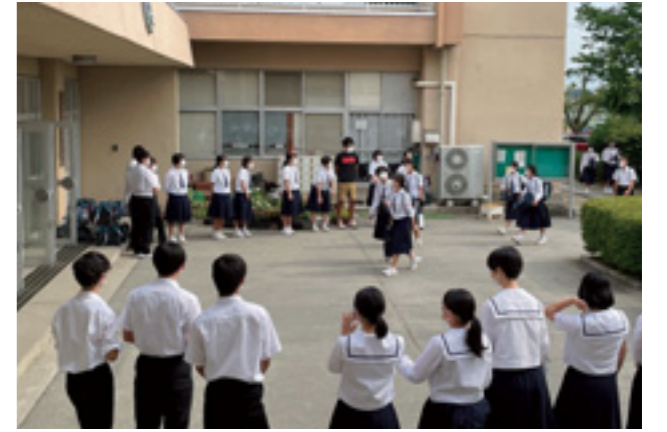
生徒玄関前のあいさつ運動

「あいさつ」は、毎朝、委員会が当番制で生徒玄関前にてあいさつ運動を行っています。廊下で教師や来客と擦れ違うときや、校庭に来客を迎え入れるときなどにも、生徒から元気なあいさつをしています。多くの来訪者から、「温かな気持ちになる」「いい雰囲気ですね」などの声を頂きます。また、西連携型小中一貫校として、校区内の美土里小・平井小・日野小の3小学校とも連携しています。中学生が小