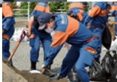
▶ 水防訓練で土のう作りをする消防団員