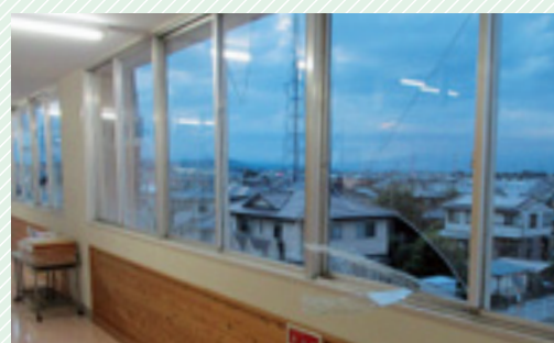
▲ 降ひょうで割れた学校の窓ガラス