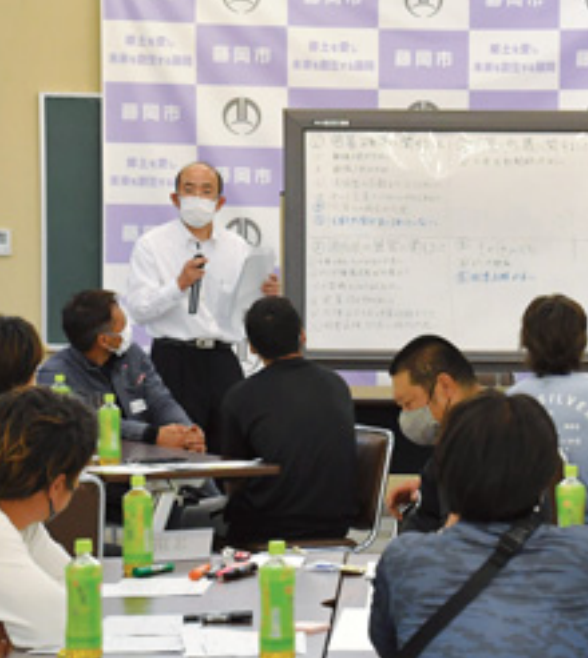
▲ 第1回消防団活動推進検討委員会の様子