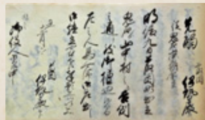
藤岡伊勢殿から出された手代の先触れの写し(県立文書館寄託文書)

さてこの古文書に出てくる「藤岡伊勢殿」の場所は現在では不明です。他地域の例では、現在の神明社が当時の伊勢殿であることが多くあります。かつて荷物や人足が集まったという伝えのある神明社が、皆さんの近くにありませんか。