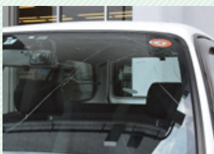
▲ ひびの入った車のフロントガラス