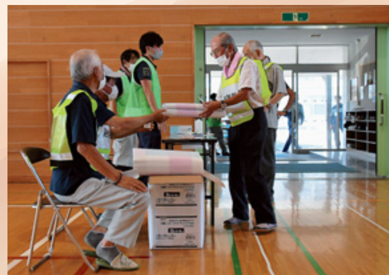
▲▶ 自主防災組織との連携を確認するための避難場所運営訓練の様子