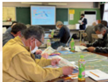
▲ 自主避難計画策定の様子

住民の相互協力の理念に基づいて、自主的な防災活動を行うことで、災害による被害の防止や軽減を目的とする組織です。市内では83団体が結成されています。 土砂災害に備えた自主避難計画 土砂災害が想定される地域では、地域住民が主体となり、土砂災害の危険箇所などをまとめた避難計画を策定して災害に備えています。 令和2年度は上日野地区、3年度には金井・下日野地区の自主避難計画を策定し、今年度は鬼石地区の策定を予定しています。