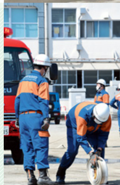
◀ ▲ 消防団員によるポンプ車訓練の様子