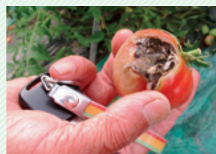
▲ ひょうに当たった部分が傷んでしまったトマト