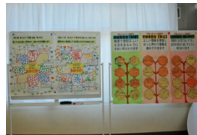
「ほっとハート宣言」に咲いた花

実行し、振り返りをする中で、学校や地域に「ほっとハート」の花を咲かせ、優しい心が広がることを目指しています