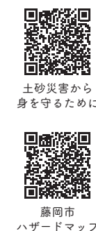
土砂災害から身を守るために 藤岡市 ハザードマップ