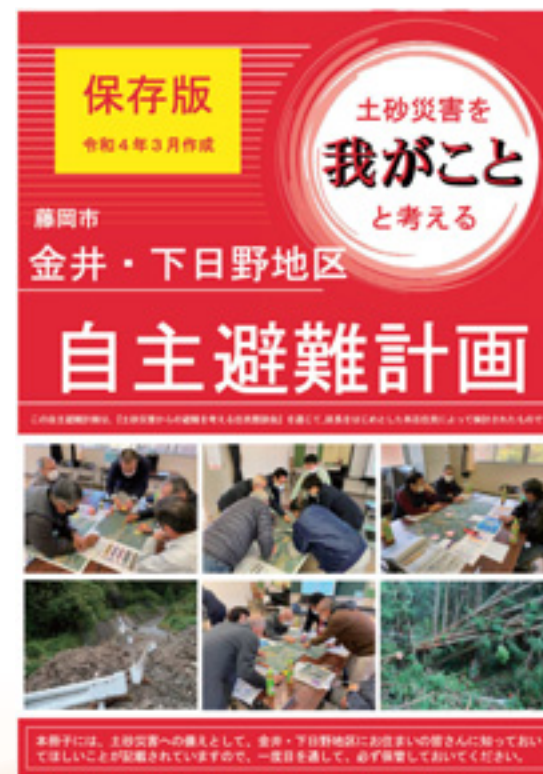
▲ 令和3年度に作成した金井・下日野地区の自主避難計画

警戒レベル5は既に災害が発生・切迫していて命の危険がある状態です。また、必ず発令される情報ではないことから、警戒レベル5を待つことなく、警戒レベル4までに必ず避難することが必要です。