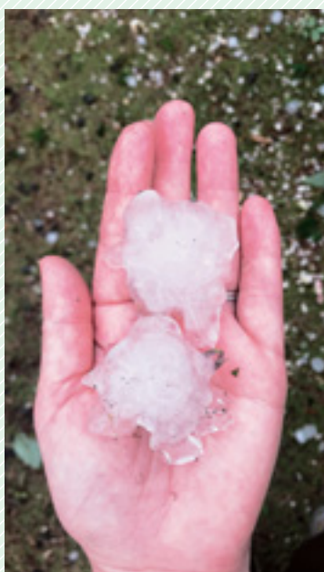
▲ 市内に降った大粒のひょう

災害は突然やってきます。いざという時のために、加入している保険の確認など、日頃から災害への備えを行っておきましょう。