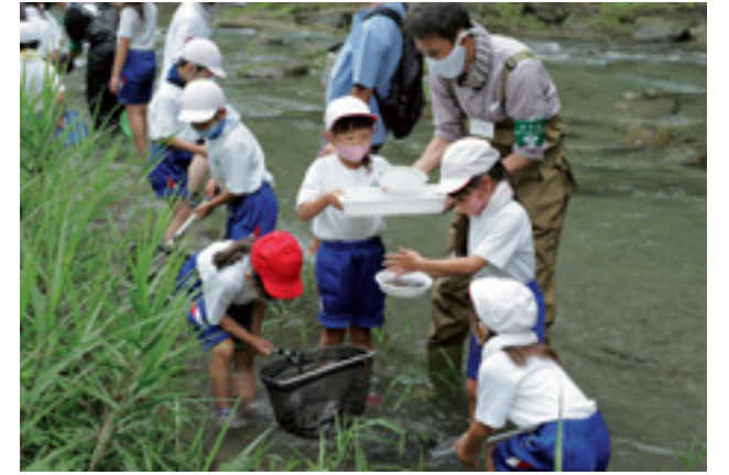
群馬県フォレストリースクール

児童が育てたサルビアやパンジーの花苗を地域の公民館や郵便局、交番などに届ける活動は、日野小の伝統であり、花を慈しむ心を育てるとともに、日頃お世話になっている地域の皆さんに感謝の気持ちを伝える大切な機会となっています。また、全校児童が毎年参加している群馬県フォレストリースクールでは、鮎川の水生生物を採集して観察する活動な