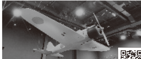
市ホームページまたは右の2次元コードからアクセスしてください