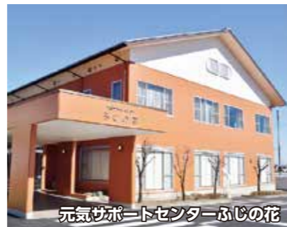
元気サポートセンターふじの花