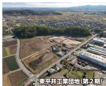
東平井工業団地(第2期)