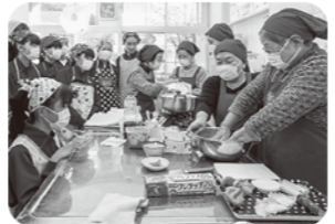
地域の人たちの学習支援

各小中一貫校にそれぞれの学校運営協議会を設置し、コミュニティ・スクールとすることで、学校・地域が協働して、学校課題の解決に向けた取り組みを進めています。その一つに学習支援があります。子どもたちは、学習支援ボランティアの人たちに支えられながら校外学習に出かけたり、授業を受けたりすることで、地域とのつながりを深め、より充実した学習を行うことができます。