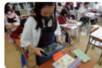
アニメーション作品制作