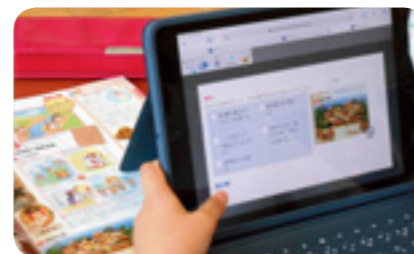
必要な資料の検索