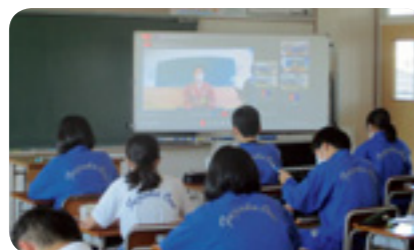
チャレンジウィーク