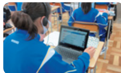
英語のリスニング学習