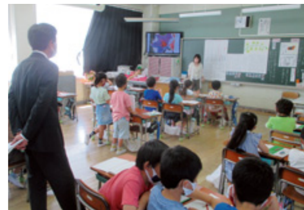
みんなで一緒に考えながら学習を進めます

教員は、子どもたちが今日の学習を自分なりの見通しや解決方法をもって進められるよう、授業の始めに子どもたちとのやりとりを通して、学習の「めあて」を