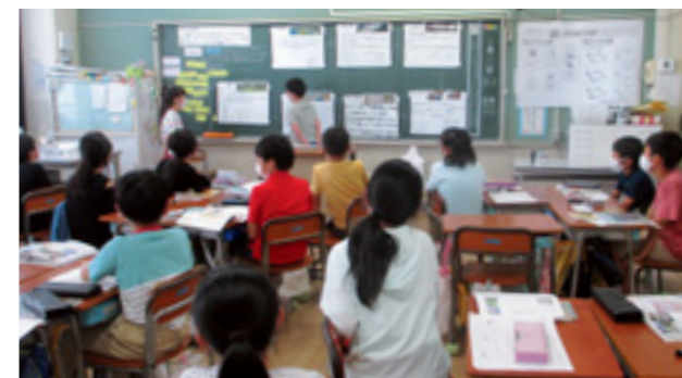
友だちの発表を真剣に聞く児童たち

現在、コロナ禍で対話的な学びや話し合いに制限がありますが、できる範囲で取り組んでいきます。