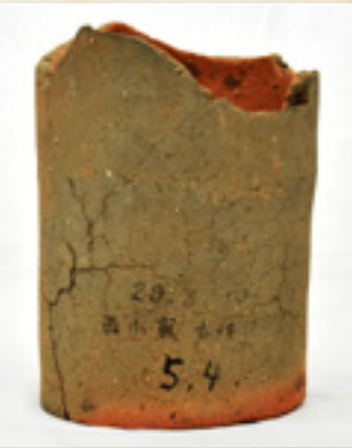
旧美九里中学校郷土部が採集した埴輪 (藤岡市所蔵)

このように、旧美九里中学校郷土部は「郷土の歴史のまもりびと」として大いに活動し、今日にその足跡を残しています。