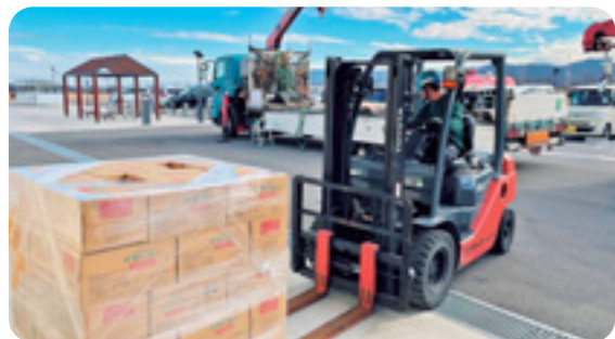
令和6年能登半島地震では、ヨシモトポール様との協定のもと羽咋市へ支援物資を配送しました

大規模な災害などが発生した場合、市や防災機関のみの対応では、保護活動に十分な対応ができないことも考えられます。そのため、ほかの自治体や民間企業などと災害時応援協定を締結し、迅速かつ確かな災害対策が実施できるようにしています。