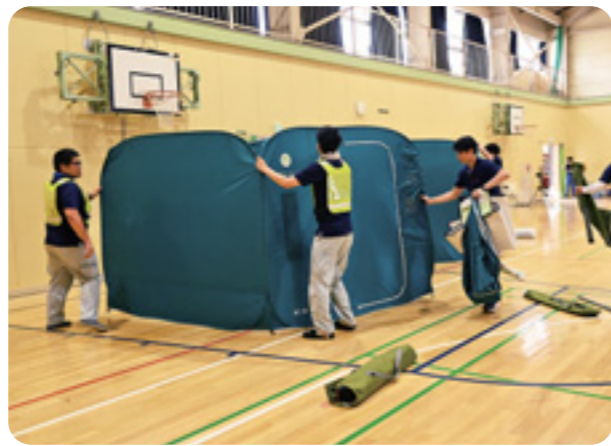
避難所開設訓練で救護者スペースを確保する様子

藤岡市ハザードマップを参考に、自分の住む地域にどんな危険があるのかを確認しましょう。