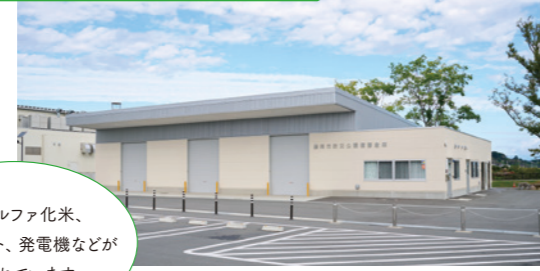
水やアルファ化米、ブルーシート、発電機などが備蓄されています。