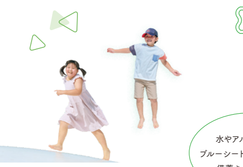
藤岡市防災公園・備蓄倉庫