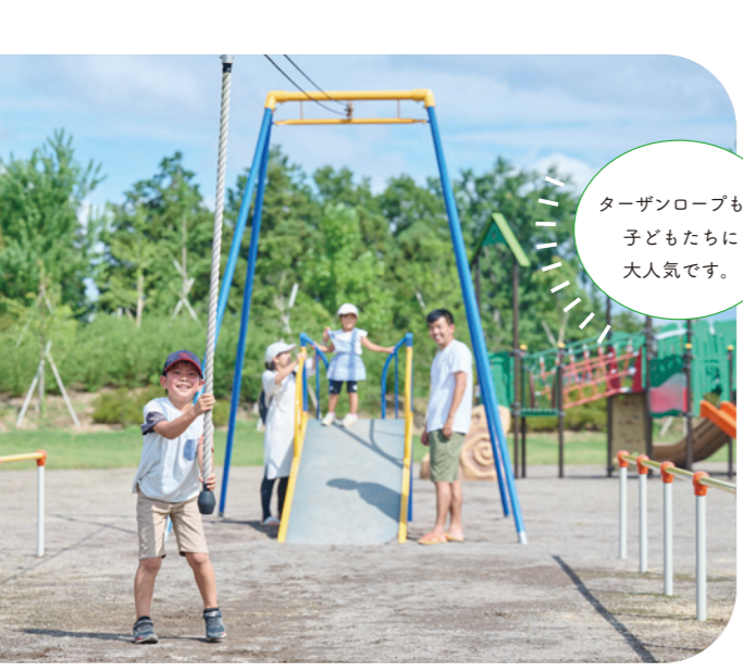
ターザンロープも、子どもたちに大人気です。

藤岡市防災公園は、令和3年に完成した新たな公園です。敷地面積は約4ヘクタール。園内には、芝生広場・遊具広場・幼児広場などがあります。遊具広場は、全長24メートルのふわふわドーム、ターザンロープや水遊びが楽しめる噴水（親水施設）があり、子どもたちの格好の遊び場になっています。普段は市民が交流し、体を動かす公園として、子どもたちのにぎやかな声が響く公園ですが、災害時には市民の緊急避難の場や災害物資の物流の拠点、仮設住宅用地などに活用できるようになっています。園内の一角には、食料や飲料水、発電機などを備蓄した備蓄倉庫があり、入口広場には、防災テントになる防災パーゴラや、炊き出し用の「かまど」に転用できるベンチがあります。ここは、誰もが安心して暮らすための防災拠点です。