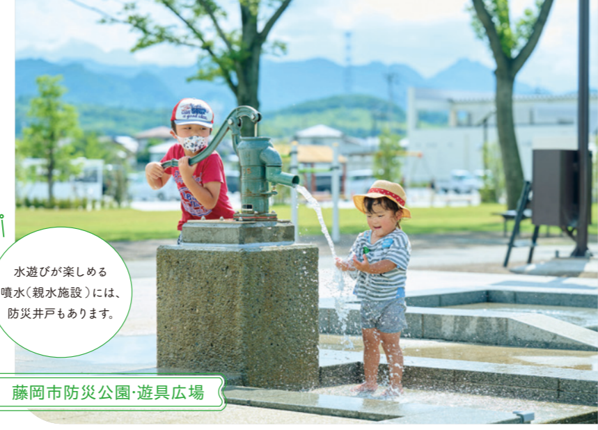
水遊びが楽しめる噴水（親水施設）には、防災井戸もあります。