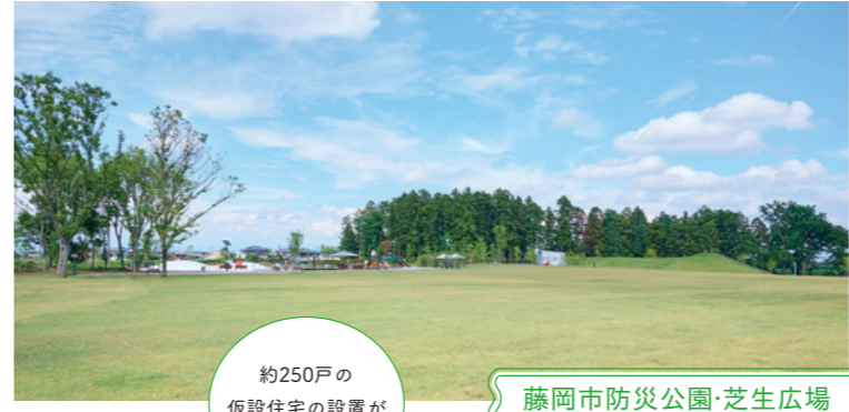
約250戸の仮設住宅の設置が可能です。