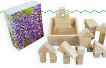
市産材を活用した積み木

We are FUJIOKA. 「We LOVE ふじおか」なヒト・モノ・コト。