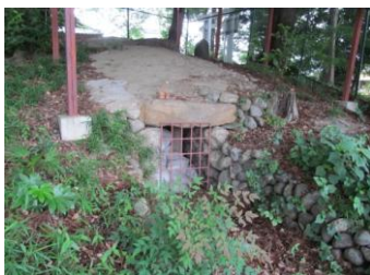
横穴式石室が口を開けている 前方後円墳・戸塚神社古墳

「百舌鳥・古市古墳群」(大阪府)が世界遺産となり、いま話題の古墳は少々小ぶりながら地区内にも多くあります。市教委職員が地元ネタもまじえてわかりやすくお話しします。