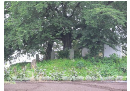
公民館からも見えるトウカ塚古墳

教室風景。工作のあと、「複屈折」「弾性」という難しいリクツの 光の性質をカンタンに目にすることのできる実験もたのしみました。