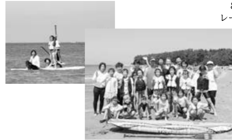
SUP体験した藤岡EASTの子どもたち

8月3日、長手島(羽咋市柴垣町)付近で、バレーボール交流会のために羽咋市を訪れていた藤岡市のジュニアバレーボールチーム藤岡EASTの子どもたちが、ボードの上に立ち、パドルを漕いで水面を進んでいくマリナクティビティ「SUP」の体験をしました。SUP体験の指導を行ったのは、長手島を活用した観光活性化と社会教育に取り組む市民団体「長手島」。「藤岡の近くには海がないので、とても楽しい」と子どもも大人も大はしゃぎの半日となりました。