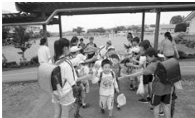
↑「さよなら」と笑顔でハイタッチをする子どもたちの声が校庭に響きます。

りのバッジが手渡され、改めて笑顔であいさつすることを決意しました。クラブ員は毎月、西中生と共に行われるあいさつ運動に参加しています。また、月曜日の集団下校の時には、通学班が順番で校門に立ち、全校児童が交代で「さよならスマイルハイタッチ運動」も実施しています。